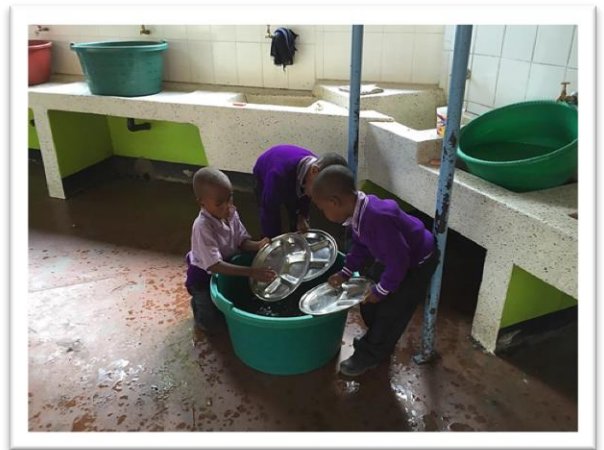
ook de kleinsten hebben taakjes