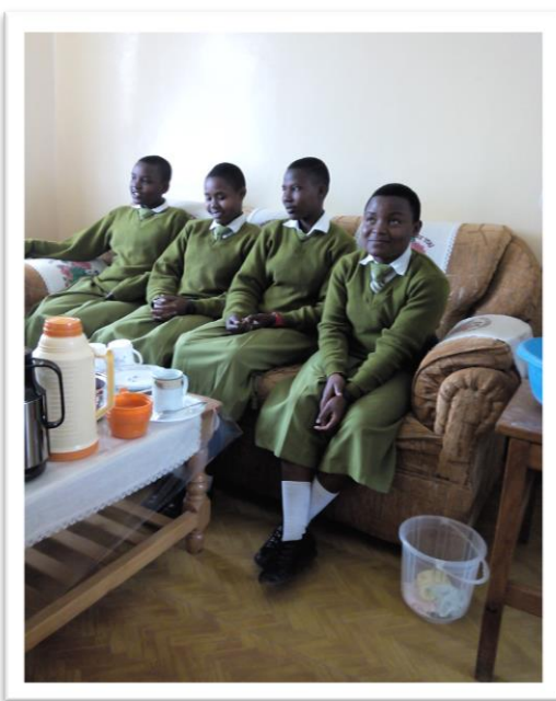
de eerste lichter meisjes bij de zusters in Henry Gogarty

In 2014 hadden we vier meisjes op Henry Gogarty School, drie jongens op Tengeru Boys School, een jongen in het Tengeru Vocational Center (ambachtsschool) en zes kinderen op de lokale Dulutih School (English medium met een minder hoog toelatingsexamen). Gogarty en Tengeru behoren tot de top scholen van het land. Met deze scholen hebben wij afspraken kunnen maken over een korting op de schoolgelden die we voor onze kinderen moeten betalen. Voor de kinderen die niet slagen voor het toelatingsexamen alhier biedt het nabij gelegen Dulutih dus uitkomst. Onze maatschappelijk werkers blijven de kinderen monitoren. Alle 14 kinderen zijn januari 2015 overgegaan naar de volgende klas en de tweede lichter vanuit Ngorika is op deze middelbare scholen aangekomen. De komende 2-4 jaar zullen we een verdere doorstroom naar de middelbare school zien, hetgeen samen met een continue instroom in Kikatiti zal leiden tot een navenante toename van de operationele kosten.