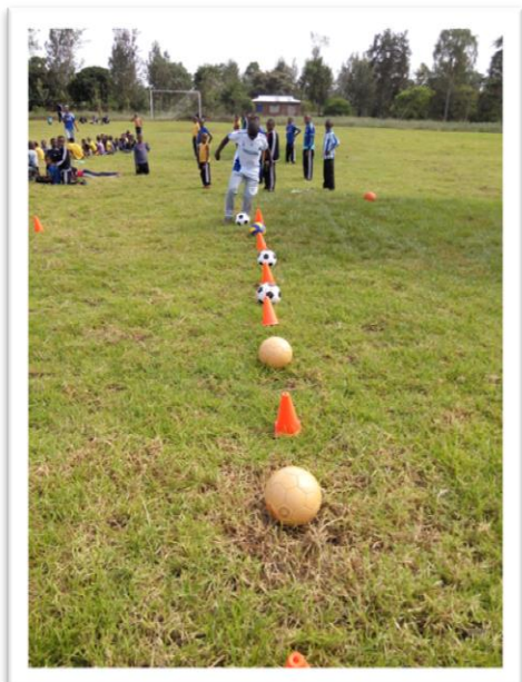
ons sportveld in Lerai sinds 2014 in gebruik

Op Lerai werd ons fraaie sportveld in gebruik genomen en wordt op grotere schaal groente en fruit verbouwd. Samen met de moestuin van Kikatiti heeft dit geleid tot een lagere kostprijs van de maaltijden. Inmiddels hebben we met een toegezegde donatie beter gereedschap en zaden kunnen kopen. Ook wordt bekeken of we een waterdrupsysteem (druppelsslangen) kunnen inzetten. Dat zou een langdurige en dus betere bewatering betekenen met minder verdamping en een besparing van dieselkosten voor de generator waarmee het water wordt opgepompt.