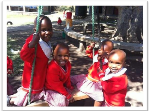
de kinderen waar wij een verschil voor kunnen maken